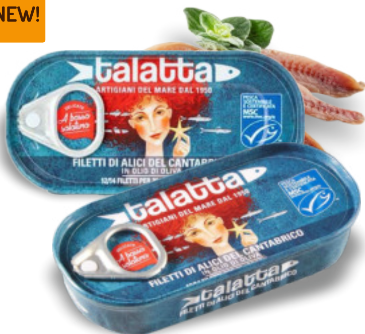
Filetti di alici del Cantabrico latta gr. 50x19 pz. AB 0501

Questi filetti di alici del Cantabrico sono lavorati a mano, in Sicilia, con l'antico metodo artigianale. Un'esperienza gastronomica completamente inedita in cui i sapori del Mar Cantabrico si intrecciano a quelli della Sicilia.