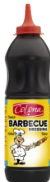
BBQ Dressing gr. 900 A00532

Una salsa dolce a base senape, arricchita da spezie di prima scelta: erba cipollina e prezzemolo. Il top con le patatine fritte!