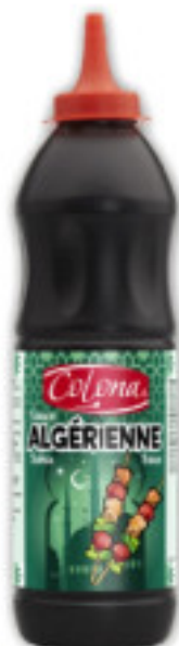
Algérienne gr. 850 A00544

Salsa di colore bruno-arancio zuccherata e al tempo stesso piccante, alle cipolle dolci, da servire in particolare con fritture e carni.