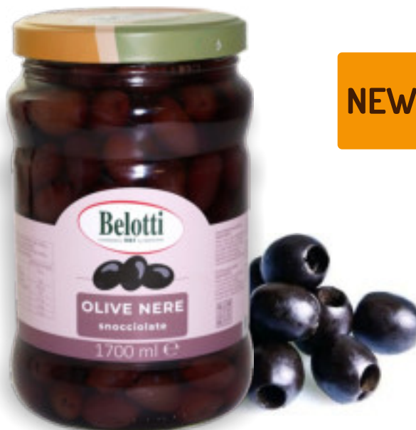
Olive Nere snocciolate ml.1700 A01767

Olive Kalamata della tradizione greca, perfette per arricchire insalate, antipasti e piatti principali.