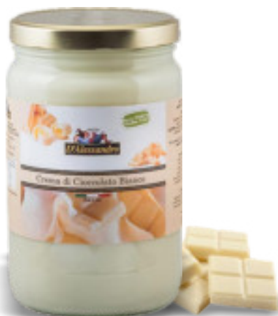
Crema di Cioccolato Bianco 2x2 Kg. A00763