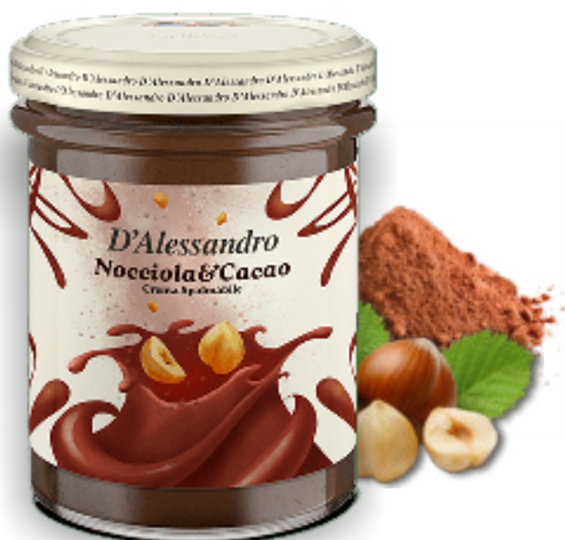
Crema Cacao & Nocciole gr. 220x6 A00740

Disponibili ai gusti: Pistacchio, Cioccolato Fondente, Nocciola&Cacao e Cioccolato Bianco metteranno d'accordo i palati di grandi e piccini. Ideali a colazione su una fetta di pane morbido o a merenda, perfette per la preparazione di crostate e frollini.