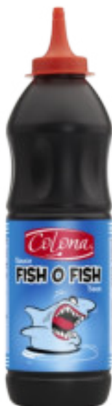
Fish o Fish gr. 900 A00535

Salsa di colore bruno-arancio, piccante ma con una leggera punta dolce, alle cipolle fruttate e ai peperoni. Ottima da servire con frittura, carni e patatine.