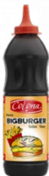
Big Burger gr. 850 A00534

Una salsa cremosa ai cetriolini, lievemente zuccherata. Da spalmare sugli hamburger e da abbinare a qualsiasi patatina fritta.