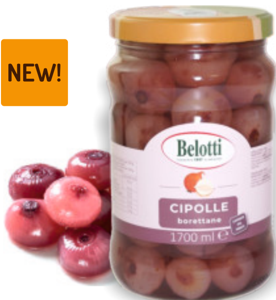
Cipolle Borettane ml.1700 A01733

Cipolle borettane dal colore intenso, sapientemente lavorate a mano con aceto di vino rosso.