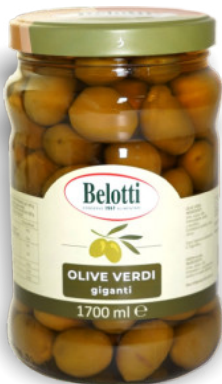
Olive verdi giganti ml.1700 A 01764

Una linea di olive completa, di alta qualità e confezionate in Italia. Per arricchire gli aperitivi o per decorare i piatti. Da quelle giganti alle denocciolate, fino alle Kalamata. Vendita anche a pezzi singoli.