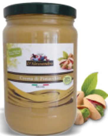
Crema di Pistacchio 20% 2x2 Kg. A00761