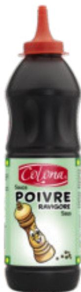
Poivre Ravigore gr. 898 A00541

Salsa piccante, di colore bruno, aromatizzata al pepe e ravvivata da un bouquet di spezie. Ottima come farcitura per panini con patate fritte e finger food.