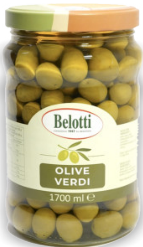
Olive verdi ml.1700 A01760

Alta qualità e prodotto confezionato in Italia, per arricchire gli aperitivi o per decorare i piatti: le classiche olive verdi 16/18, sia in vaso, che in latta per grandi consumi. Vendita anche a pezzi singoli.