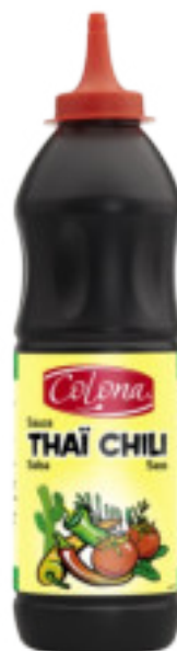
Thai Chili gr. 880 A00537

Salsa di colore bianco, molto simile alla salsa greca, spiccatamente caratterizzata dal sapore di cetriolo. Fantastica con il pesce alla brace e fritto.