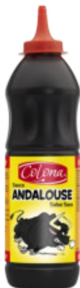
Salsa Andalousa gr. 840 A00533

Salsa di colore bruno-arancio, piccante ma con una leggera punta dolce, alle cipolle fruttate e ai peperoni. Ottima da servire con frittura, carni e patatine.