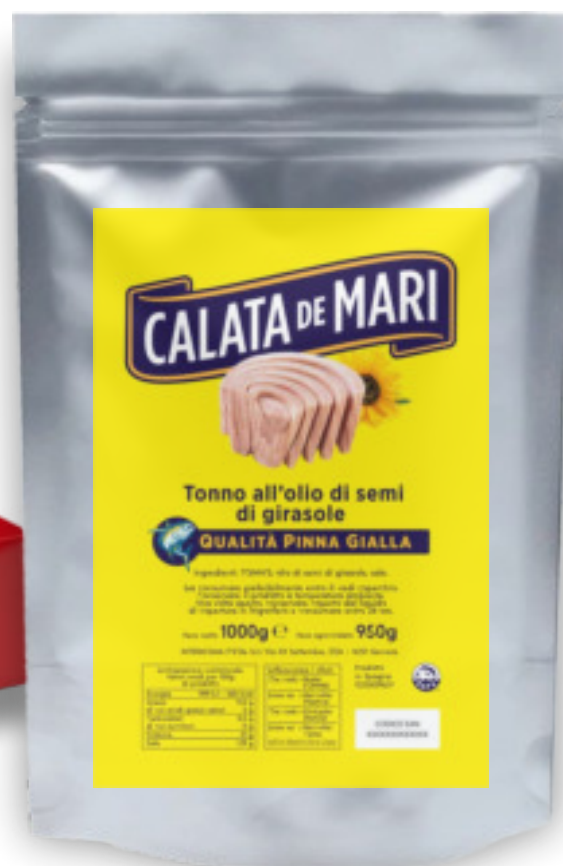
Tonno Yellowfin in olio semi di girasole busta Kg.1x12 pz. AB0655