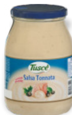
Salsa Tonnata Kg.1x6 A01270