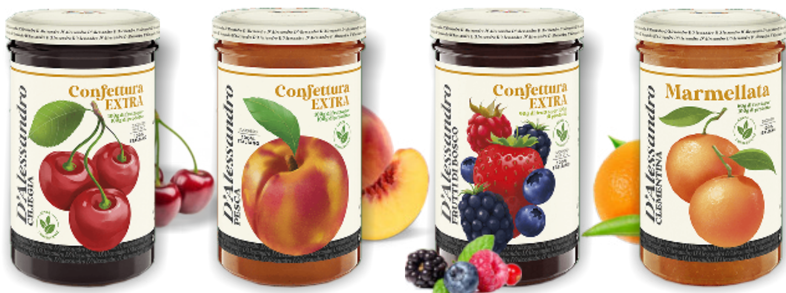
Confettura di Ciliegia gr. 310x6 A00724