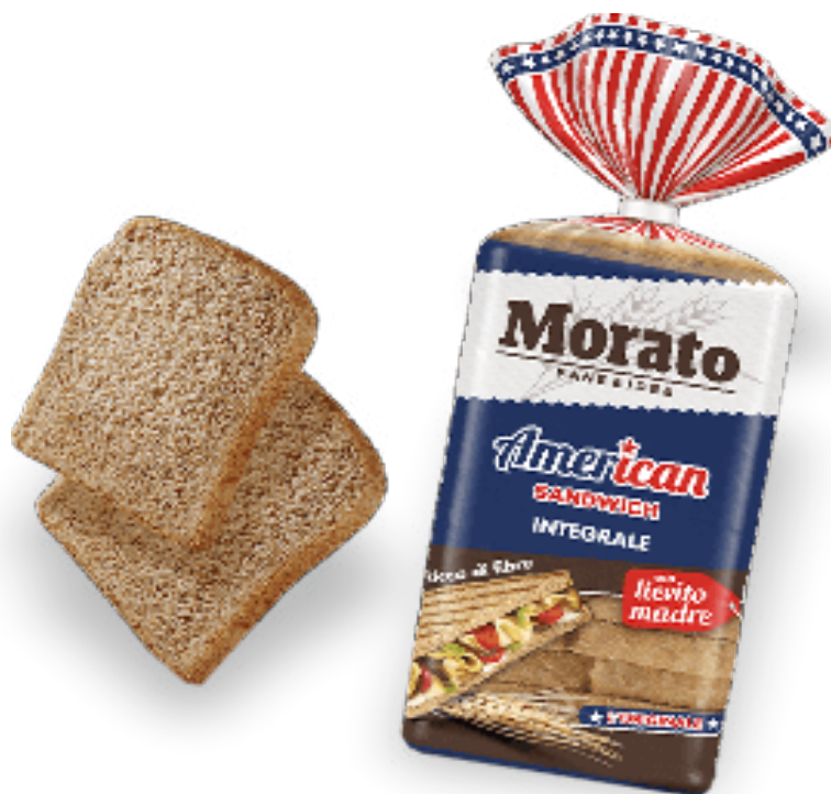
Pane Americano Integrale gr. 600x9 A00182

20 soffici fette di pane da sandwich americano, realizzate con farina integrale, ideali per spuntini veloci e perfette con ogni gustosa farcitura.