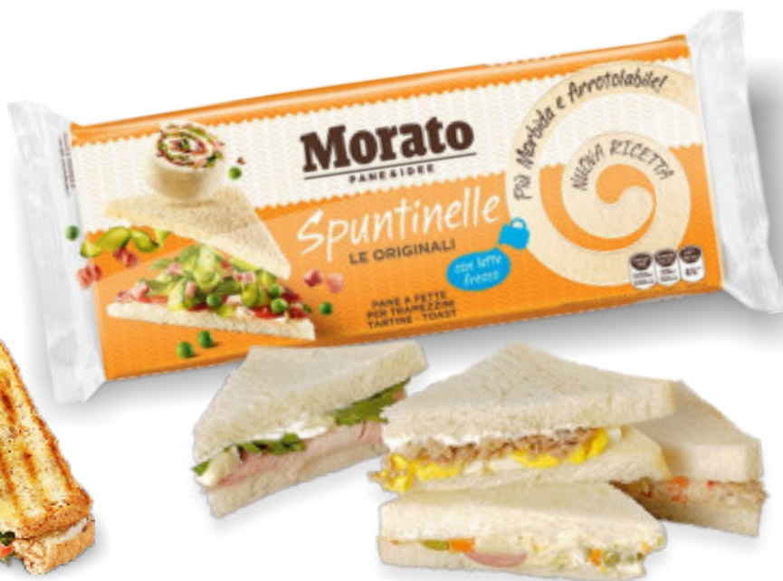
Spuntinelle Classiche gr. 700x6 A00173

L'equilibrio perfetto tra il sapore e la fragranza del pane, le Tenerelle vi stupiranno per la loro versatilità: perfette per preparare croccanti toast per un pranzo veloce o per uno snack fuori orario.