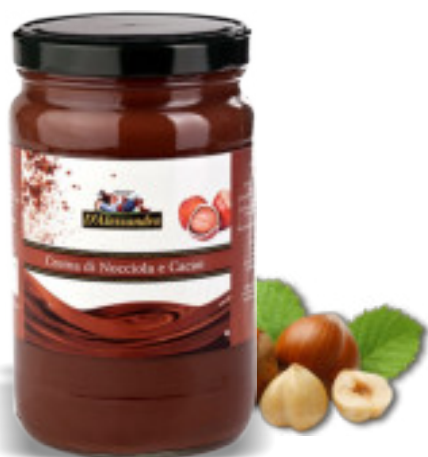
Crema di Nocciole e Cacao 2x2 Kg. A00760

Le materie prime usate per queste confetture e creme provengono dalle colline dell'Abruzzo. La frutta viene cotta sottovuoto a bassa temperatura per preservarne al meglio il sapore naturale. Non contengono conservanti né coloranti. Una linea completa di farciture d'eccellenza, non solo per brioches e croissant ma anche gelati, waffles, pancakes, crêpes, ecc.!