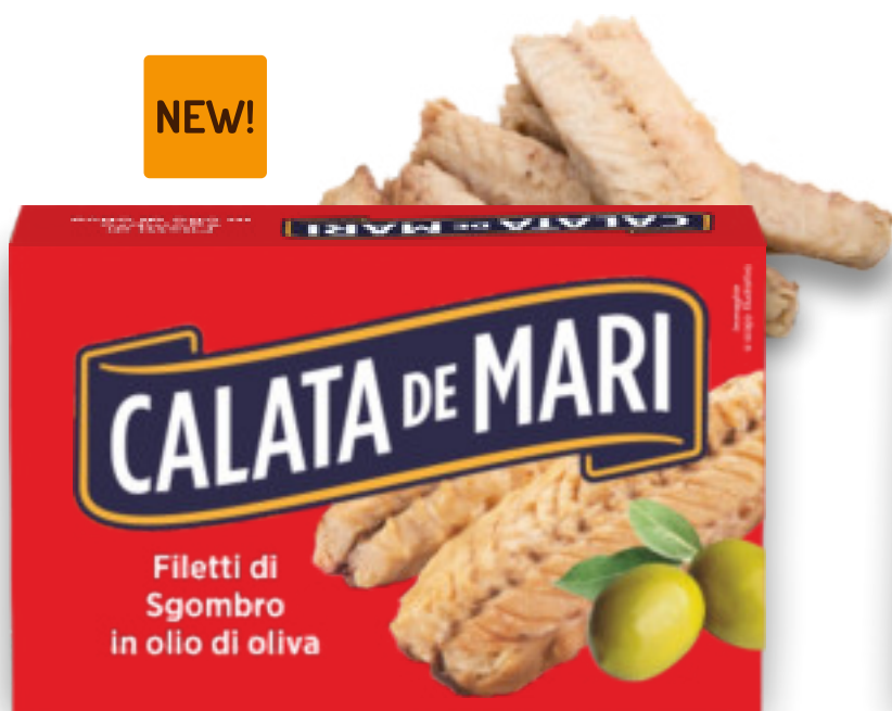
Filetti di sgombro in olio di oliva gr.120x25 pz. AB0675