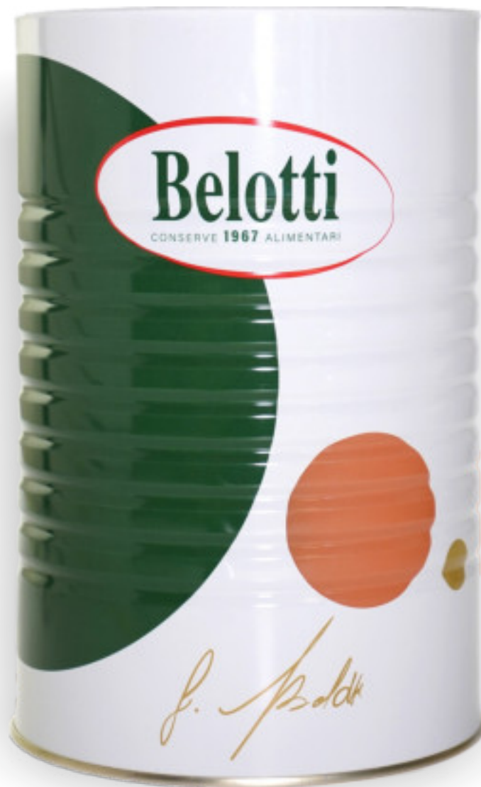
Olive Verdi 16/18 latta kg.4,25 A01762