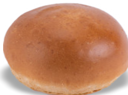
Pane per Hamburger Classico gr.115x30 A00261