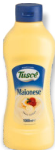
Maionese Kg.1x6 A01260