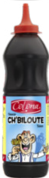
Ch'Biloute gr. 909 A00540

Salsa piccante, di colore bruno, aromatizzata al pepe e ravvivata da un bouquet di spezie. Ottima come farcitura per panini con patate fritte e finger food.