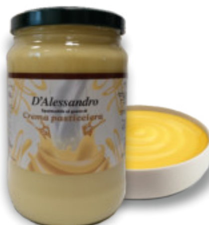
Crema Pasticcera 2x2 Kg. A00765