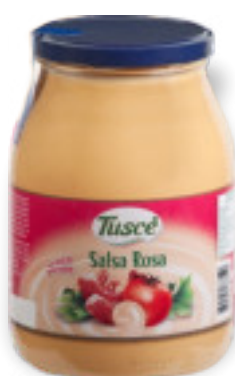
Salsa rosa Kg.1x6 A01266