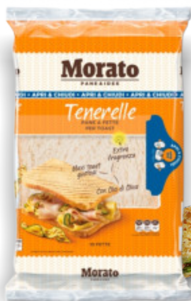
Tenerelle gr. 500x8 A00172

L'equilibrio perfetto tra il sapore e la fragranza del pane, le Tenerelle vi stupiranno per la loro versatilità: perfette per preparare croccanti toast per un pranzo veloce o per uno snack fuori orario.