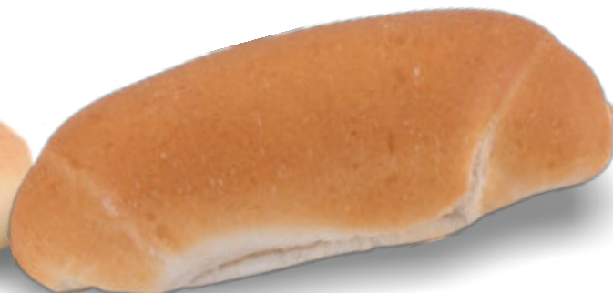
Pane per Hot Dog gr.115x30