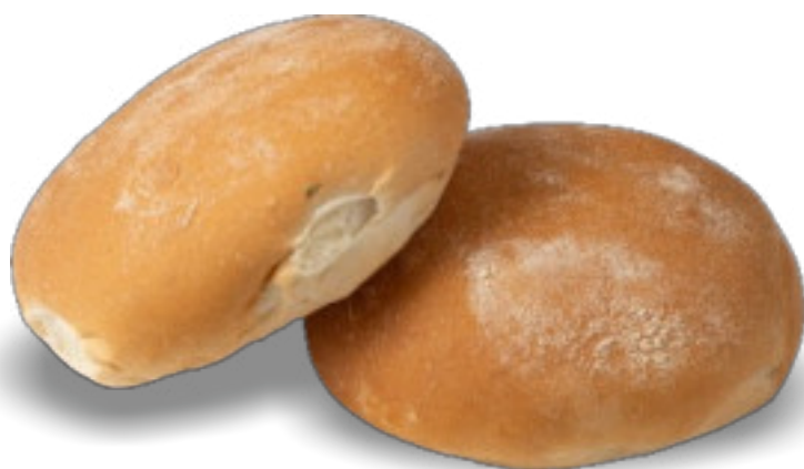
Pane «Il Cilentano» gr.115x30 A00265