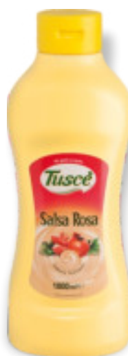
Salsa rosa Kg.1x6 A01267