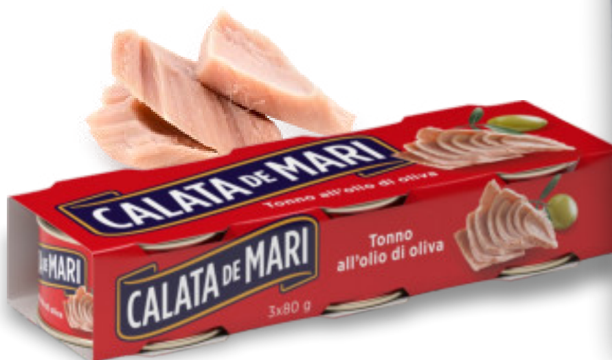
Tonno lattina 3x80 gr. blister gr.240x32 pz. AB0650