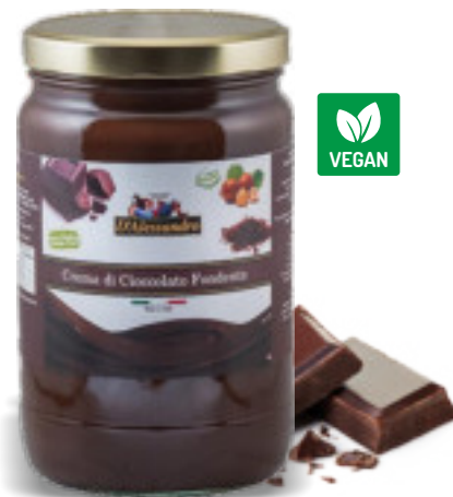
Crema di Cioccolato Fondente 2x2 Kg. A00762