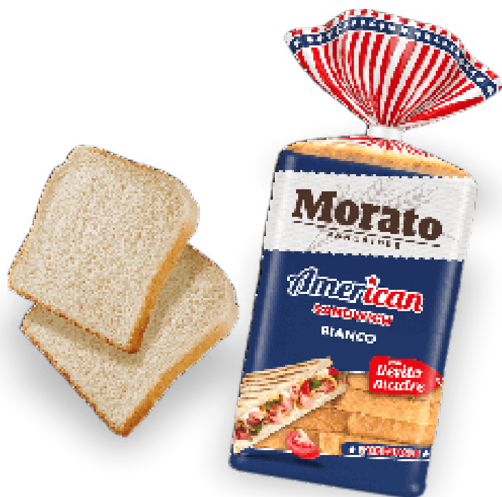
Pane Americano gr. 825x6 A00181

20 soffici fette di pane da sandwich americano, per creare sfiziosi spuntini da portare con voi per un goloso picnic o per un pranzo veloce in giro per la città.