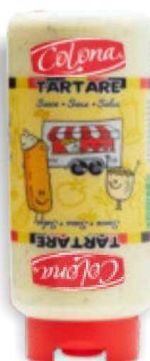
Tartare gr. 805 A00520

Una salsa cremosa ai cetriolini, lievemente zuccherata. Da spalmare sugli hamburger e da abbinare a qualsiasi patatina fritta.