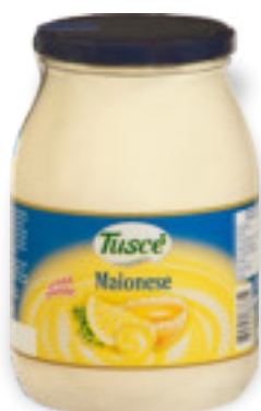
Maionese Kg.1x6 A01258