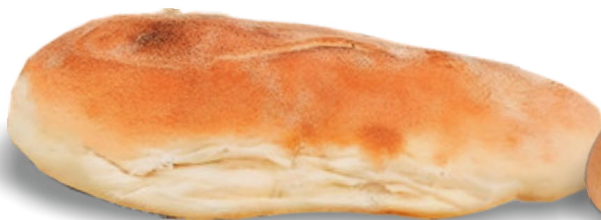
Ciabattina con fibre gr.130x1 A00269