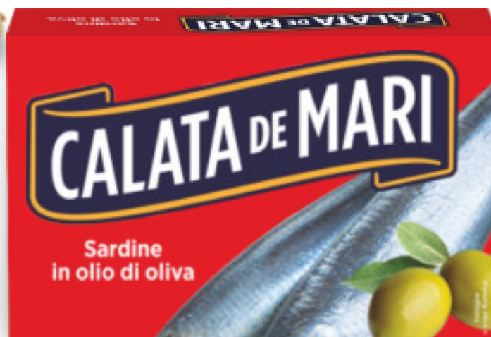
Sardine in olio di oliva gr.120x25 pz. AB0676