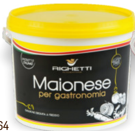
Maionese Kg.5x1 A01264