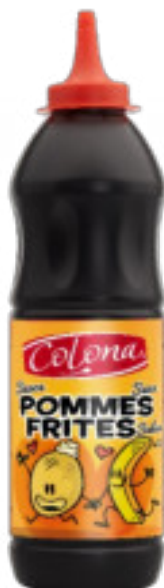
Pommes Frites gr. 919 A00543

Salsa di colore bruno-arancio zuccherata e al tempo stesso piccante, alle cipolle dolci, da servire in particolare con fritture e carni.