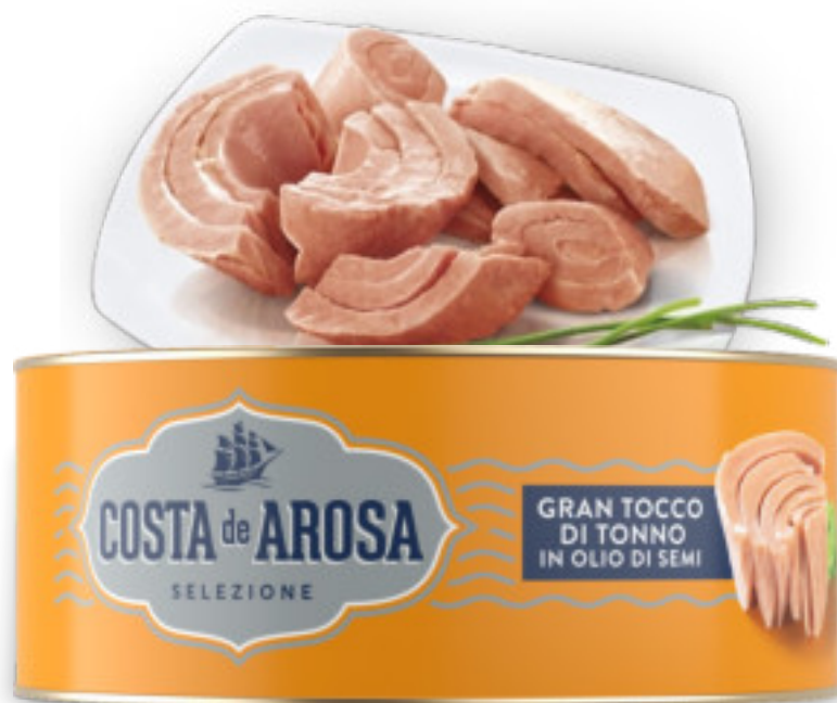
Gran tocco di tonno Kg.1x12 pz. AB0612

Il pescato migliore lavorato seguendo la tradizione sul luogo di pesca, anche dal fresco, nel rispetto degli equilibri sociali ed ambientali: il pescato viene selezionato e lavorato con accuratezza, tradizione e rispetto di tutta la filiera produttiva.