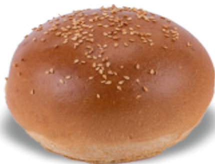
Pane per Hamburger Sesamo gr.115x30 A00263

Nuovi panini per hamburger, non gelo ma a temperatura ambiente ! Un prodotto top, artigianale e lavorato a mano il cui impasto permette al pane di svilupparsi bene in verticale, ottimi per panini dall'aspetto pieno e corposo. Disponibili con e senza sesamo e nell'esclusiva variante «Il Cilentano», un panino farinato e rustico che si sposa bene con ogni tipo di farcitura ed è una bella alternativa al classico pane hamburger.