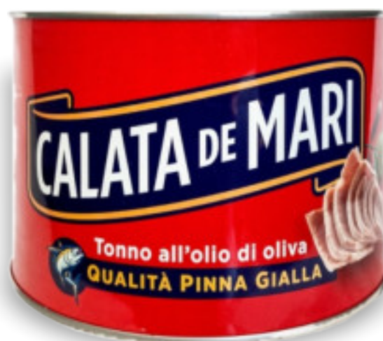
Tonno Yellowfin latta Kg.1,73x6 pz. AB0622